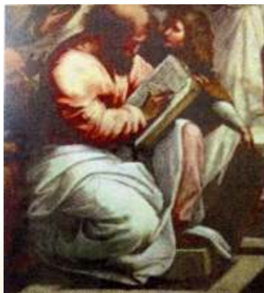
Dettaglio della Scuola d'Atene (1511) di Raffaello Sanzio raffigurante Pitagora