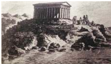
Il Tempio di Hera Lacinia in una stampa francese del Settecento raffigurante "Pythagore au milieu de ses disciples" Da G. Asturi, storie di una città, Catanzaro 1969